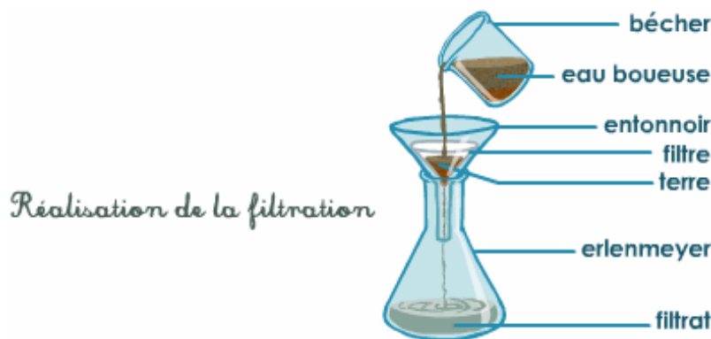
Filtration d'eau boueuse

Exemple : on peut rapidement filtrer de l'eau boueuse grâce à cette technique.